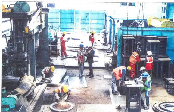
WAY FORWARD: The state, in consultation with the domestic industry and global firms, can work out incentives that would lead to large-scale investment and employment generation.

The Chinese, on the other hand, made symbolic gestures to please the West but followed the smart industrial policies that South Korea and Japan had pursued to catch up with advanced industrial economies. The state steered the economy with pragmatic policies. The problem with our mindset was reflected in the comments of Chief Economic Adviser V Anantha Nageswaran at the release of