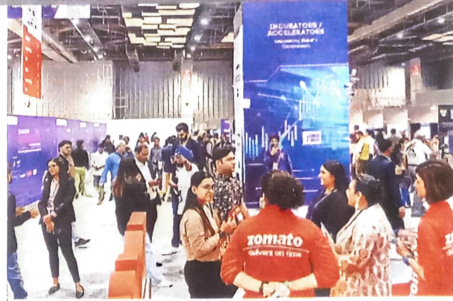
भारत मंडप में हुए स्टार्टअप महाकुंभ देश भर से कंपनियां पहुंची थी