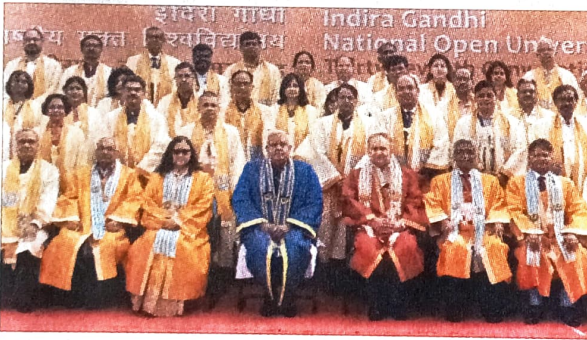
Vice President Jagdeep Dhankhar during the event, in New Delhi on Tuesday

He lauded the role played by IGNOU in nurturing well-rounded individuals and praised the institution for its commitment to promoting equity, inclusivity, and excellence in higher education, in